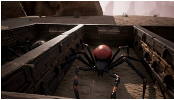
Spinne (Rote Witwe)

Lebenspunkte: 98 Rüstungswert: 34 Verteidigungswert: 25