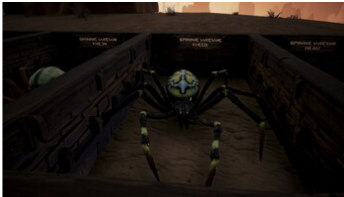
Spinne (Gelbe Witwe)

Lebenspunkte: 110 Rüstungswert: 40 Verteidigungswert: 25