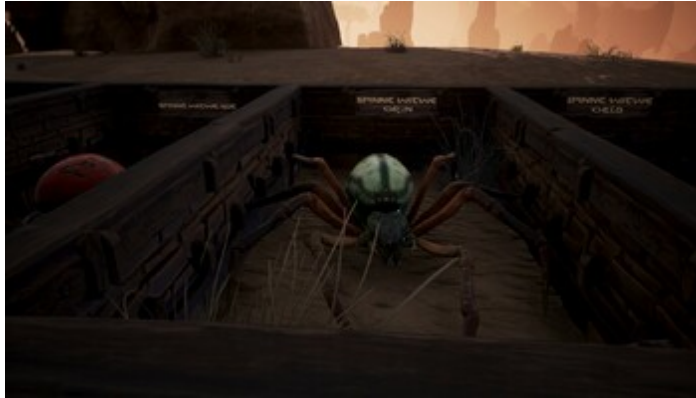
Spinne (Grüne Witwe)

Lebenspunkte: 110 Rüstungswert: 40 Verteidigungswert: 25