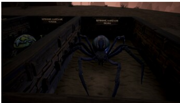
Spinne (Blaue Witwe)

Lebenspunkte: 85 Rüstungswert: 28 Verteidigungswert: 25